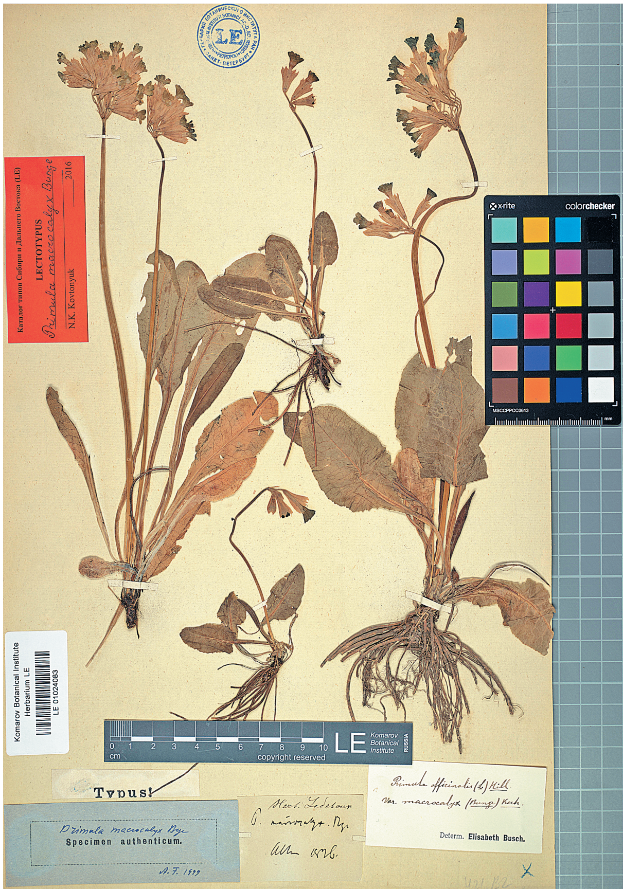
Рис. 1. Лектотип Primula macrocalyx Bunge (LE01024083).