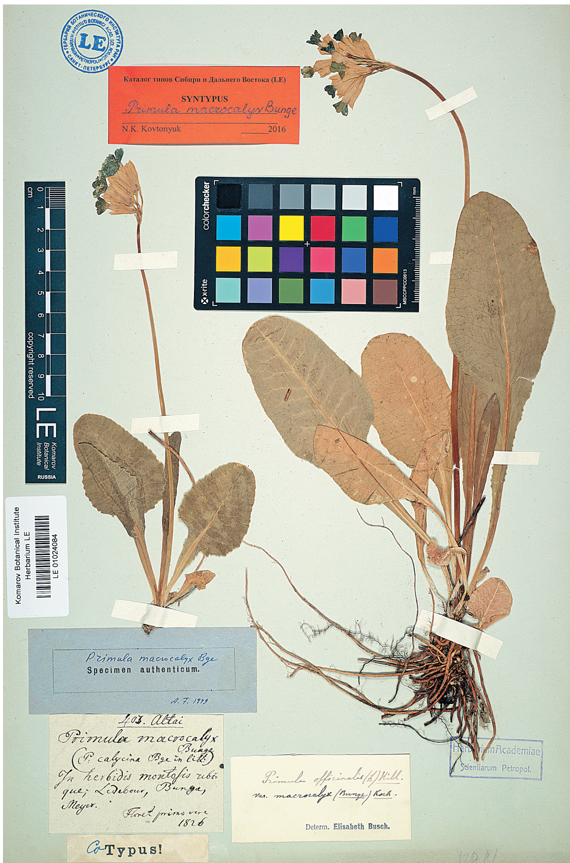
Рис. 2. Синтип Primula macrocalyx Bunge (LE01024084).