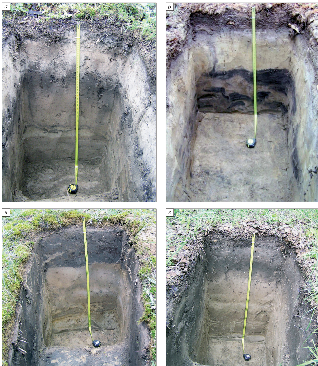
Рис. 1. Морфологическое строение мерзлотной солоды ( а – разрез 1БС-18), мерзлотного подзола иллювиально-гумусово железистого ( б – разрез 2БС-18), мерзлотной перегнойно-карбонатной почвы ( в – разрез 5БС-18) и мерзлотной палевой серой почвы ( г – разрез 8БС-18).

Разрез 5БС-18 заложен на территории ЯБС, на контуре искусственного ельника разнотравно-зеленомошного. Географические координаты: 62^{\circ}01'20.5'' с. ш., 129^{\circ}37'15.7'' в. д., H - 98.5 м н. у. м. (рис. 1, в ).