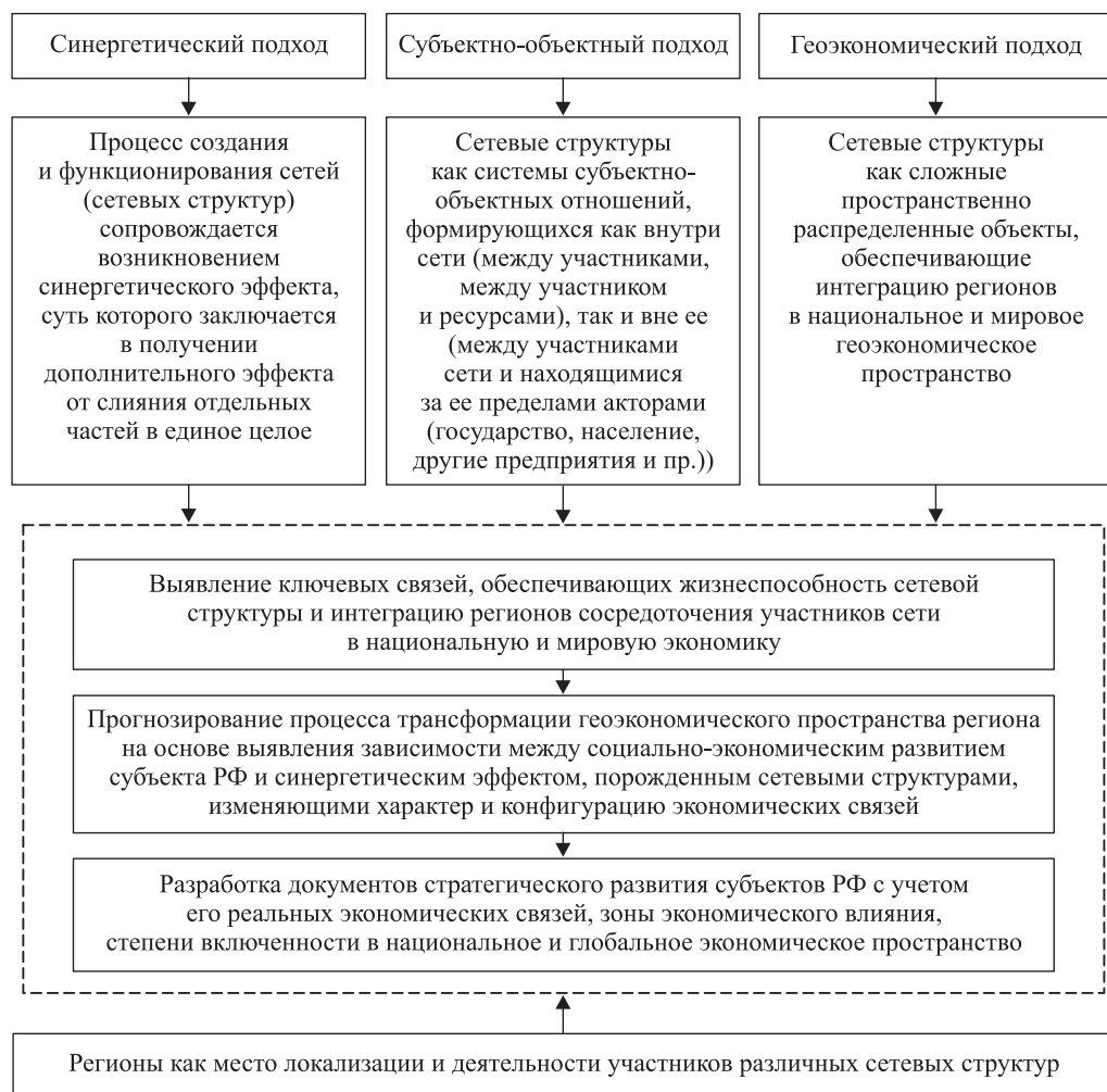
Рис. 3. Сущность и содержание авторского методологического подхода к исследованию сетевых структур в региональной экономике.