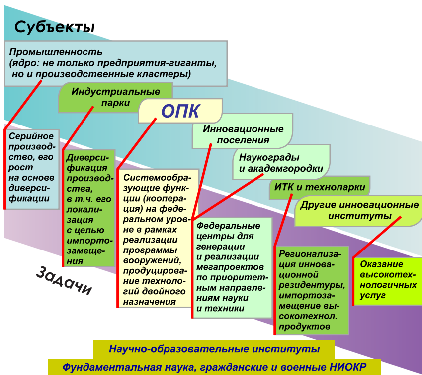
Рис. 2. Региональная «линейка» реиндустриализации: субъекты наукоемкого промышленного производства и их задачи