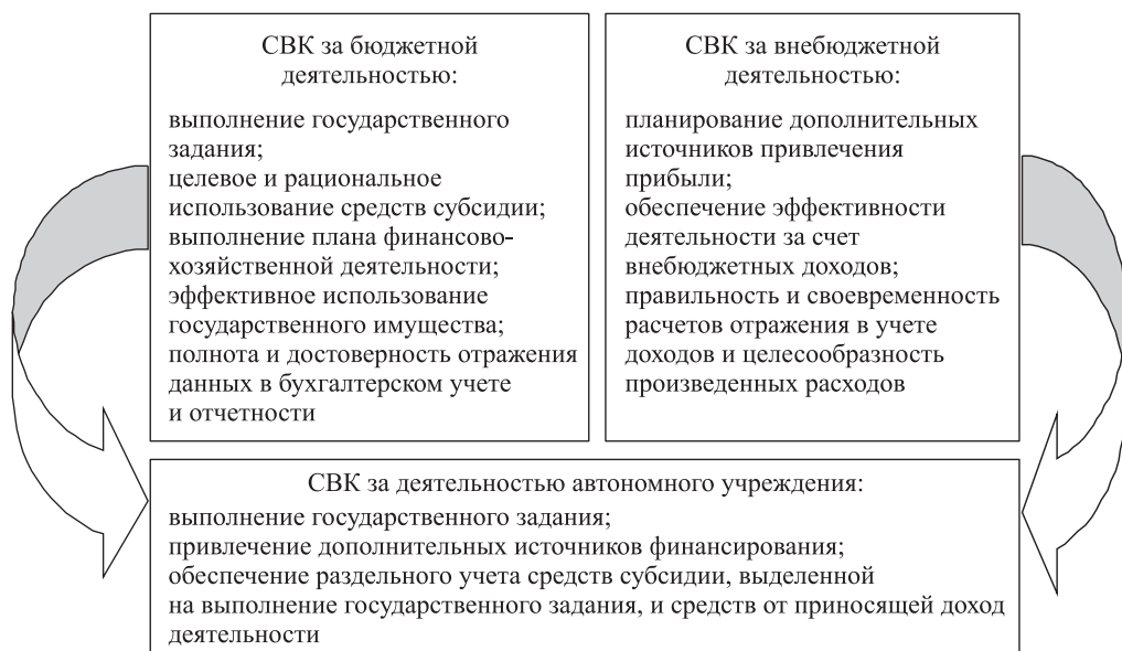
Рис. 1. Система внутреннего контроля автономного учреждения [5]