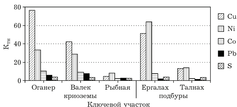
Рис. 1. Коэффициенты техногенного накопления ( K_{тн} ) тяжелых металлов и серы в почвах ключевых участков равнинной и горной территории

(криоземах) и близких к нейтральным почвам (подбурах), что обусловлено генетическими свойствами исследуемых почв, приведенных ниже.