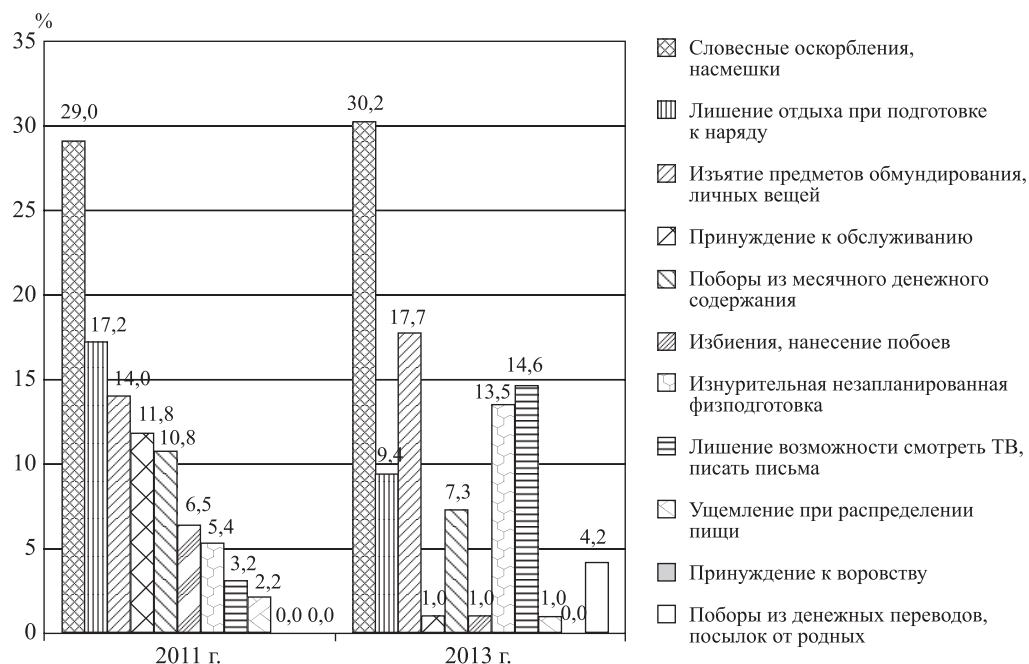
Рис. 2. Проявления в рамках существующих форм агрессии (% от общего количества ответов 4 )

Таким образом, в ходе социологических обследований наличие в воинском подразделении «неуставных взаимоотношений», связанных с проявлением той или иной формы агрессии, по большей части как минимум 20 % военнослужащих указывают открыто на данную проблему. Остальные члены личного состава предпочитают не предоставлять информацию по данному вопросу.