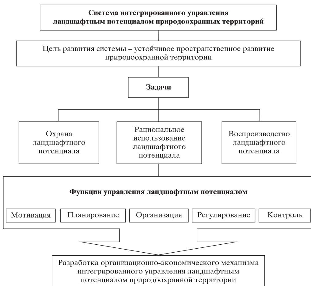
Рис. 1. Содержание интегрированного управления ландшафтным потенциалом природоохранной территории

Основными функциями интегрированного управления ландшафтным потенциалом природоохранной территории выступают мотивация, планирование, организация, регулирование и контроль.