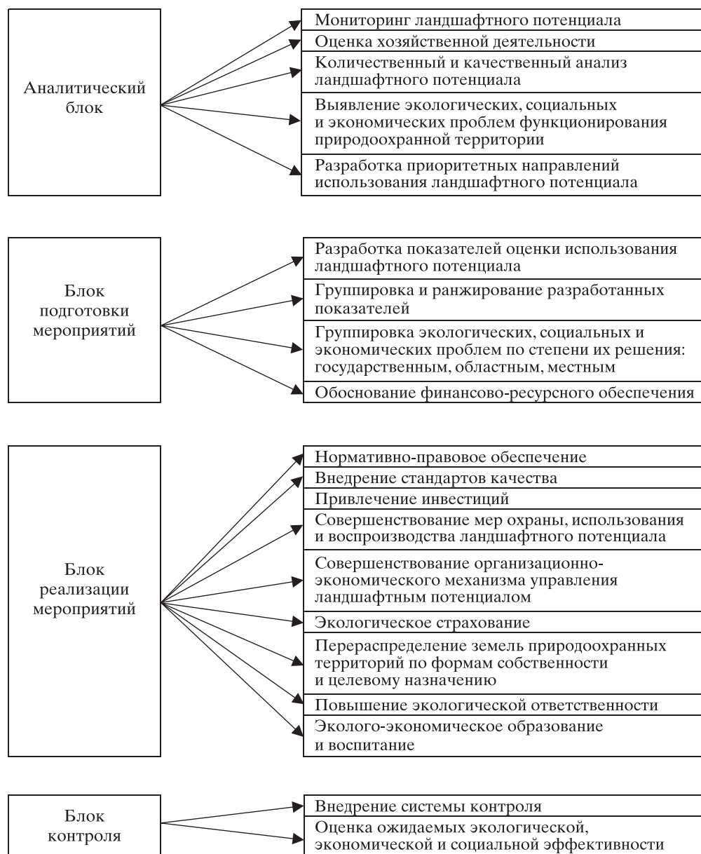
Рис. 3. Алгоритм организационно-управленческих действий в системе интегрированного управления ландшафтным потенциалом природоохранной территории

Алгоритм организационно-управленческих действий для обеспечения охраны, рационального использования и воспроизводства ландшафтного потенциала природоохранной территории включает в себя аналитический блок, блоки подготовки и реализации мероприятий и установления контроля (рис. 3).