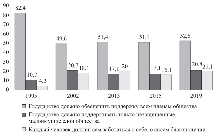
Рис. 1. Необходимость государственной поддержки, по мнению незанятых граждан, зарегистрированных в службе занятости (% к опрошенным)

Остановимся на результатах исследования. Особую актуальность при использовании активных мер содействия занятости приобретает прием незанятыми гражданами для себя тезиса о необходимости в большей степени проявлять активность в поиске своих трудовых занятий и в меньшей степени надеяться на государство (рис. 1).