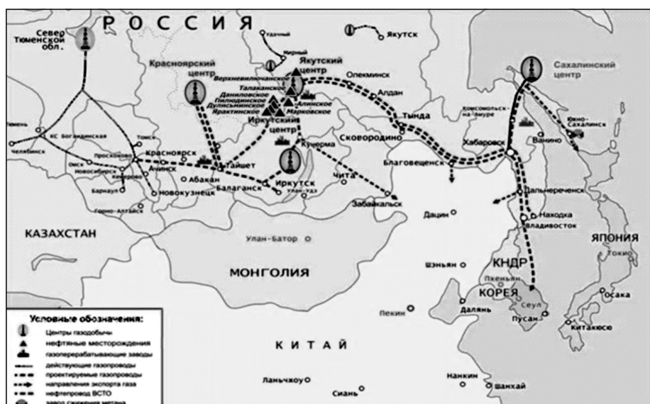
Рис. 2. Схема размещения центров газодобычи и проектируемых газопроводов в Восточной Сибири и на Дальнем Востоке

В настоящее время сложились благоприятные предпосылки для начала формирования в восточных регионах страны новых центров газовой промышленности общероссийского значения и расширения Единой системы газоснабжения на восток (рис. 2). Такие предпосылки обусловлены значительным приростом запасов газа в восточных регионах страны – Иркутской и Сахалинской областях, Республике Саха (Якутия), Красноярском крае.