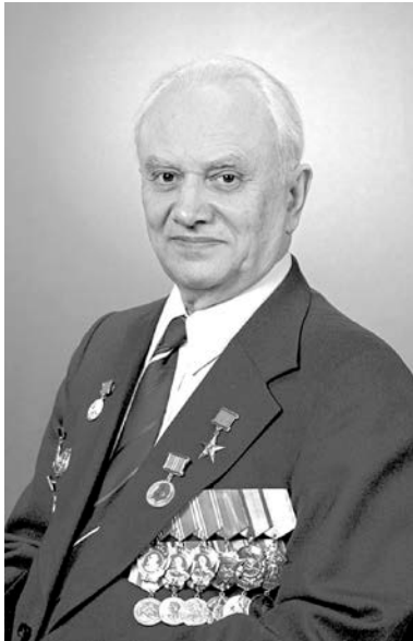
Герой Социалистического Труда академик С.С. Кутателадзе (1984 г.).

показателей без экспертизы профильными специалистами имеет массу очевидных недостатков.