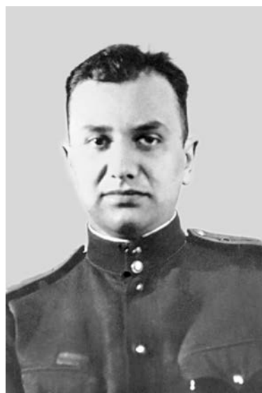
Самсон Кутателадзе — старший техник-лейтенант (1945 г.).