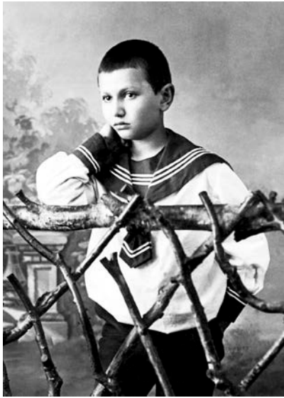
Ленинград. Самсон Кутателадзе — школьник (1924 г.).

В 1933 году он осуществил первое комплексное моделирование теплового режима подземных трубопроводов горячей воды на мелкомасштабных моделях. Это была актуальная физико-техническая проблема, связанная с бурным строительством в стране крупных теплофикационных систем. Затем в 1935 году им была представлена модель свободного турбулентного течения у твердой поверхности с введением понятий о вязком подслое с собственным значением числа Рейнольдса и струйном течении во внешней области потока.