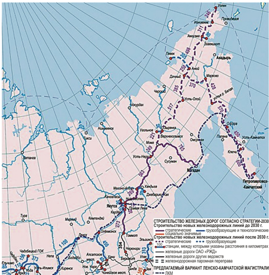
Рис. 3. Ленско-Камчатская магистраль в составе Стратегии-2030