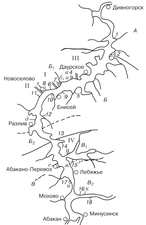
Рис. 1. Схема расположения участков наблюдений за переработкой берегов и развитием подпора подземных вод на Красноярском водохранилище.

Четко прослеживается взаимосвязь поверхностных и подземных вод, особенно на участ-