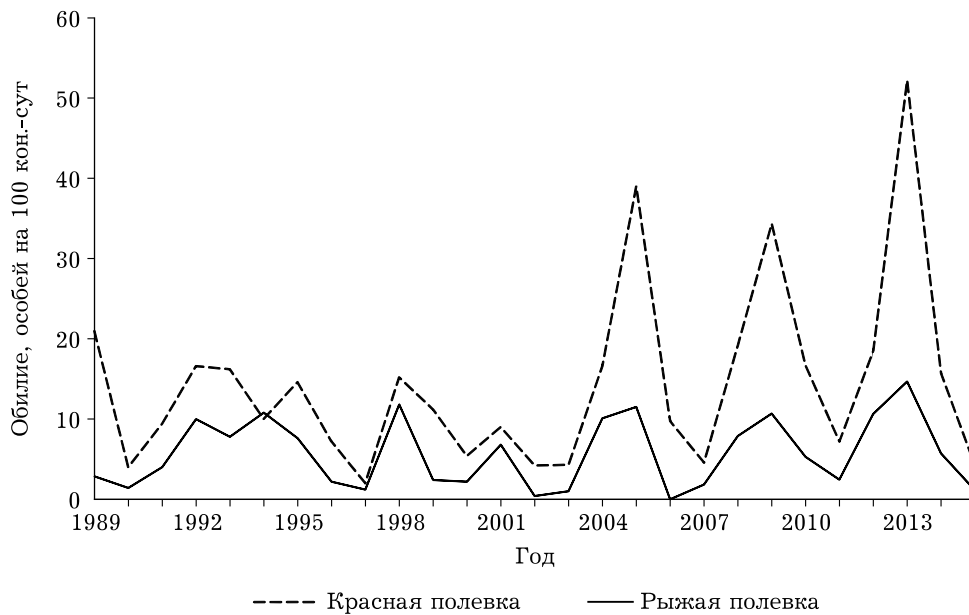
Рис. 3. Многолетние изменения численности лесных полевок в равнинном районе Печоро-Ильчского заповедника

ка – 110,3 экз. на 100 кон.-сут. Доля первого вида уменьшилась до 27,1 %, а доля второго увеличилась до 72,9 %.