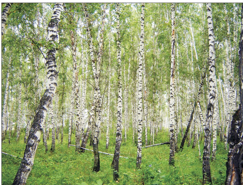
Рис. 1. Березняк разнотравно-злаковый V класса возраста в зоне воздействия выбросов промышленных предприятий и автотранспорта Красноярска (ПП 2).

увлажнения (ГОСТ 12026-76). Всхожесть определяли по ГОСТ 13056.6-75. За начало проращивания считали день, следующий за днем раскладки орешков. Продолжительность проращивания составляла 20 сут (ГОСТ 13056.6-97). Для определения жизнеспособности учитывали показатели всхожести (20 сут) и энергии прорастания (7 сут), а также среднюю длину проростков (20 сут). Измерения проводили при помощи стереоскопического микроскопа Микромед-МС-1. Достоверность различий рассчитывали по критерию t_{st} .