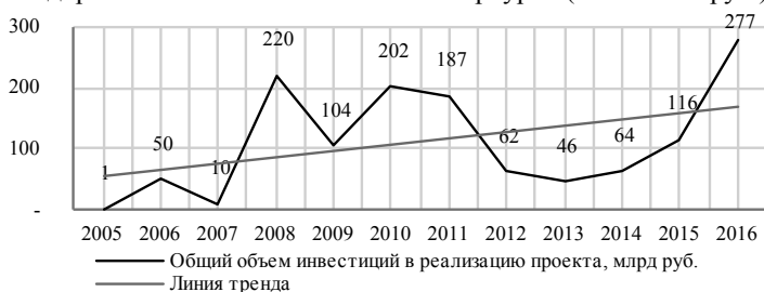
Рис. 2. Общая сумма инвестиций в реализацию совместных государственно-частных проектов в 2005–2016 гг., млрд руб.

Заметные «взлеты» в изменении совокупного объема инвестиций в 2008 г., 2010 г. и 2011 г. (рис. 2) объясняются заключением отдельных крупных соглашений. Так, в 2008 г. на динамику инвестиций повлияло заключение соглашения о строительстве автодороги «Западный скоростной диаметр» на сумму 12 720 млн руб. (или 96% инвестиций 2008 г.) [17]. В 2010 г. 90% всех инвестиций пришлось, во-первых, на заключение двух контрактов жизненного цикла метровагонов на сумму 119 891 млн руб.; во-вторых, на заключение концессионного соглашения о строительстве северного дублера Кутузовского проспекта на сумму 61 000 млн руб. В 2011 г. крупнейшими проектами стали создание и эксплуатация «Новой железнодорожной линии необщего пользования Бованенково – Сабетта» (сумма контракта – 113 141 млн руб.) и строительство участка скоростной автодороги М-11 «Москва – Санкт-Петербург» (49 600 млн руб.).