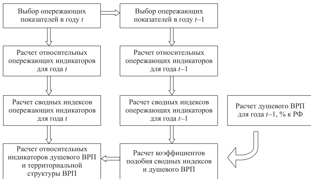
Рис. 1. Логическая схема оценки ВРП по набору опережающих показателей