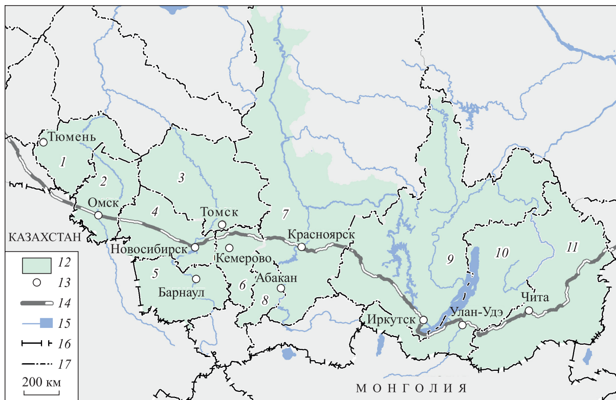
Рис. 1. Схема регионов транссибирского коридора.

Сибирь — территория, включающая два крупных географических макрорегиона страны: Западную и Восточную Сибирь общей площадью 6,6 млн км 2 с населением 22,5 млн чел. (на 01.01.2023 г.) [1, 2]. Социально-экономическое развитие за последние два столетия — со времен сооружения Московского тракта (XVIII в.), затем Транссиба (конец XIX—начало XX в.) и вплоть до начала второй половины XX в. (начало освоения углеводородных месторождений центральной и северной частей Западной Сибири) — определялось преимущественно ее южными, относительно благоприятными, территориями. Согласно действующим документам пространственного развития страны в условиях