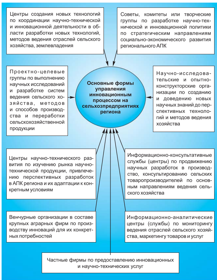
Рис. 1. Формы управления инновационным процессом на сельхозпредприятиях Самарской области