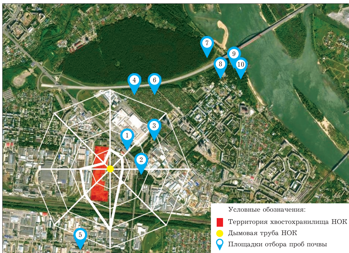
Рис. 1. Карта-схема расположения точек отбора проб относительно Новосибирского оловянного комбината (НОК) с указанием диаграммы повторяемости направлений ветра за период 1966–2018 гг.

Расположение точек отбора проб, диаграмма повторяемости направлений ветра (роза ветров) за период 1966–2018 гг. представлены на рис. 1. Точка штиля розы ветров совмещена с дымовой трубой НОК.