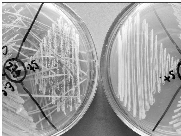
Рис. 1. Оценка фитонцидной активности хвои клона на 279 с использованием тест-системы S. epidermidis (слева – опыт, справа – контроль).

ра кроны деревьев срезали и помещали в холодильный контейнер. Каждый клон представлен тремя случайно отобранными раметами. Через 6 ч после заготовки образцы охвоенных побегов доставляли в лабораторию Центрального сибирского ботанического сада СО РАН для анализа.