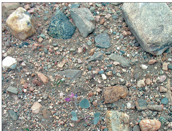
Рис. 5. G. monophylla в опустыненной петрофитной разнотравно-карагановой степи с высокой степенью пастбищной дигрессии.

Анализ семенной продуктивности в четырех ЦП (табл. 2) показал, что такие параметры, как количество семязачатков и семян на плод, незначительно различаются в разных местообитаниях (14–19 семязачатков на боб), чуть больше различается количество семян на один плод – 7–13 семян на боб. При этом потенциальная семенная продуктивность (ПСП) составила в среднем 195, от 116 (ЦП Ховд 3) до 308 (Ховд 2) семязачатков на особь. Реальная семенная продуктивность (РСП) в среднем составила 51 семя на особь. Максимальные показатели РСП отмечены в ЦП Ховд 2, где растения наиболее мощные и завязывают 74 семени на особь, а самые низкие (36 шт. на 1 растение) – в ценопопуляции Ховд 4. Процент семенификации (ПС) – 17.3–50 %. Невысокие значения этого параметра могут быть обусловлены низкой фертильностью растений, недостаточным опылением (обу-