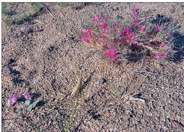
Рис. 2. G. monophylla в опустыненной трагакантовой песчаной степи в окрестностях г. Ховд.

Хуш, 30 VII 1979, З.В. Карамышева, У. Беккет и др.; долина Улан-Эргийн-Гола, гранитная сопка Му-Улан-Толгой, 12 VIII 1979, В.И. Грубов, Л. Мулдашев, Ш. Дарийма.