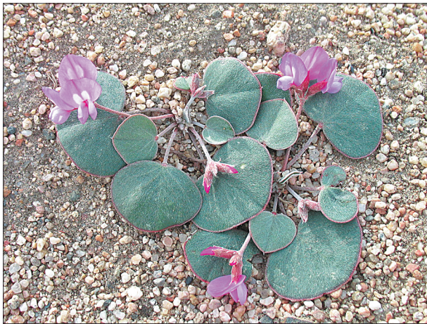
Рис. 1. Gueldenstaedtia monophylla – Гюльденштедтия однолистная.

крупных участка ареала расположены в Центральном Алтае и Северо-Западной Монголии. Вид с узкой экологической амплитудой, обитает на сухих каменистых и щебнистых склонах, на скалах и каменистых россыпях, выходах известняков, на маломощных песках и солонцеватых прибрежных галечниках (Яковлев, 1980; Растения Центральной Азии, 1988).