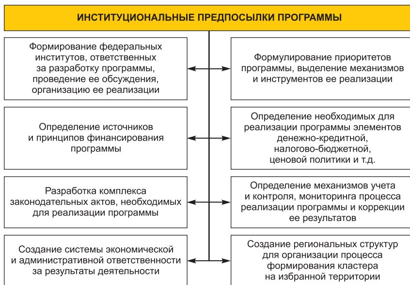
Рис. 1. Институциональные предпосылки комплексной программы региональной аграрно-промышленной кластеризации

Особенностью нашего предложения является то, что аграрно-промышленный кластер формируется не только и не столько за счет