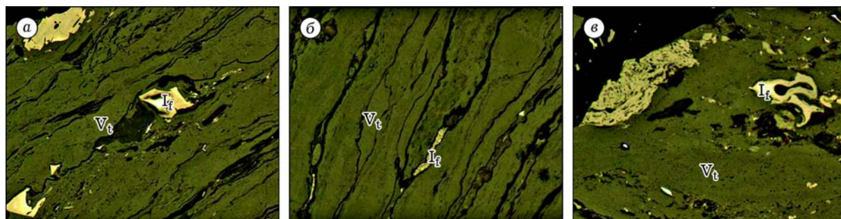
Рис. 1. Микрокомпоненты гумусовых углей: V_t – группа витринита; I_f – группа инертинита. Отраженный свет, масляная иммерсия, ув. 300.

В углях подсчитывается содержание групп (в %): витринита V_t , семивитринита S_v , инертинита I_f , сумма отошающих компонентов \Sigma O_K . Некоторое представление об облике микрокомпонентов, объединяемых в перечисленные группы, могут дать микрофотографии (рис. 1). Под микроскопом заметна выраженная структура угля: среди витринизированного веще-