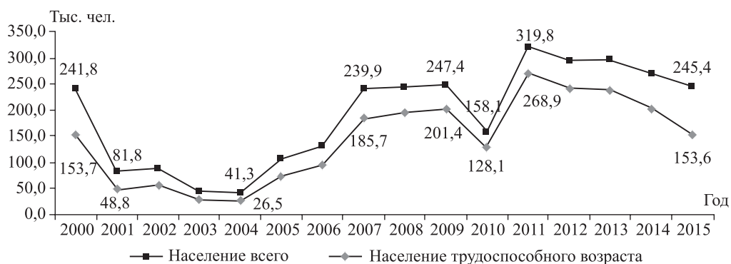
Рис. 1. Миграционный прирост населения в трудоспособном возрасте в России.

Доля мигрантов в трудоспособном возрасте в России достаточно высока (среднее значение за 2000–2015 гг. составило 75 %) и выступает показателем «преимущественно трудового характера даже постоянной миграции..., так как превышает долю трудоспособных в населении страны (60,8 %)» [12, с. 351]. Кроме того, поскольку в миграционных процессах участвует в основном молодое трудоспособное население, это оказывает влияние на рождаемость.