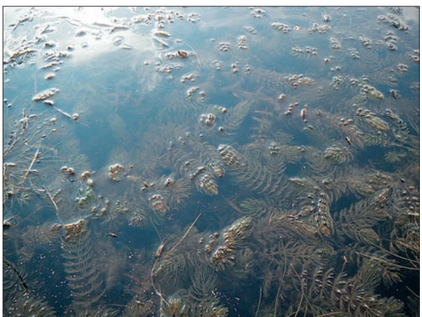
Рис. 8. Сообщество асс. Ceratophylletum demersi в протоке Талая (Алтайский край, Первомайский р-н, 31.07.2017).