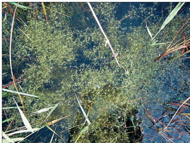
Рис. 5. Фрагмент ценоза ряски тройчатой асс. Lemnetum trisulcae на р. Карасук (Новосибирская обл., Кочковский р-н, 05.08.2009).