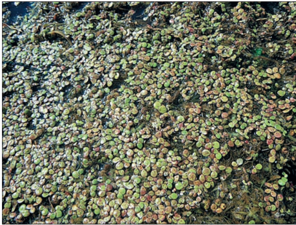
Рис. 3. Сообщество асс. Lemno minoris-Spirodeletum polyrhizae на оз. Ора (Алтайский край, Зональный р-н, 26.07.2017).