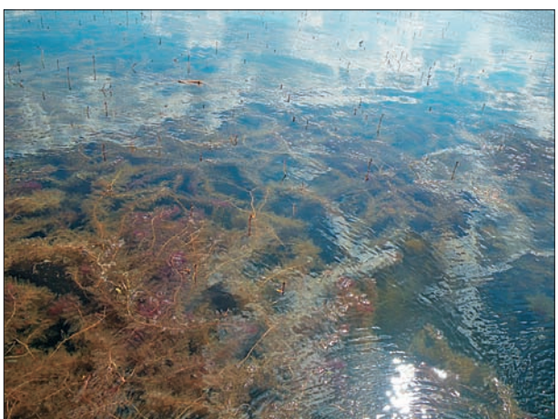
Рис. 10. Сообщество асс. Utricularietum macrorhizae на оз. Лена (Алтайский край, Баевский р-н, 06.07.2014).