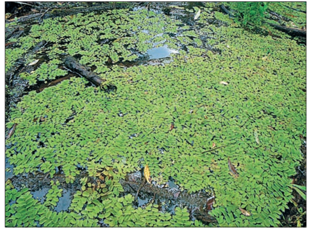
Рис. 4. Ценоз асс. Salvinio natantis-Spirodeletum polyrhizae в протоках р. Обь (Алтайский край, Усть-Пристанский р-н, 26.07.2016).

тивное покрытие сообществ ассоциации – 80–100 % (среднее – 95.3 %).