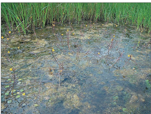
Рис. 9. Ценоз пузырчатки обыкновенной асс. Lemno-Utricularietum vulgaris на оз. Камбала (Новосибирская область, Куйбышевский р-н, 23.07.2015).