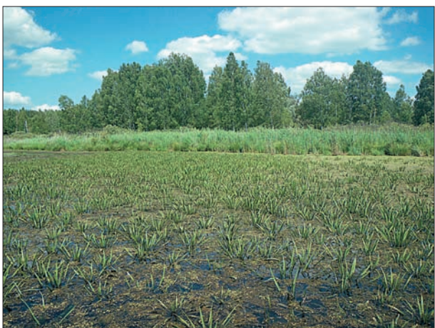
Рис. 7. Ценоз асс. Stratiotetum aloidis на оз. Ора (Алтайский край, Зональный р-н, 26.07.2017).