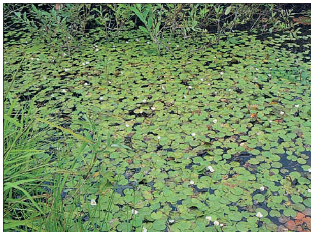
Рис. 6. Сообщество асс. Hydrocharitetum morsus-ranae на оз. Манжерок (Республика Алтай, Майминский р-н, 15.08.2017).