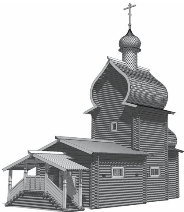
Рис. 1. Церковь Владимирской Богоматери в Братске. До 1707 г. Реконструкция А.Ю. Майничевой, А.Н. Кулакова. Компьютерная графика А.Н. Кулакова.