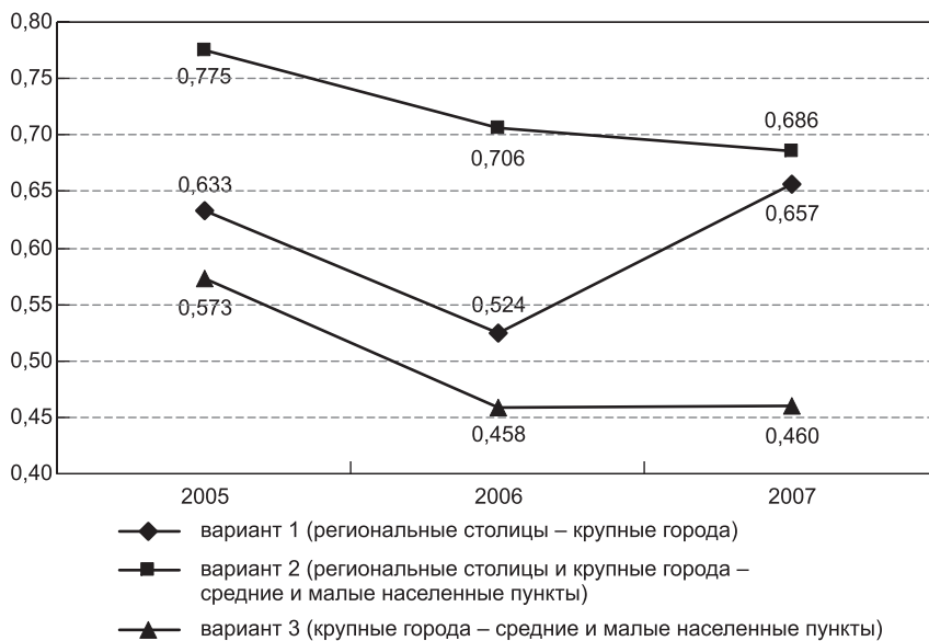
Рис. 3. Медианные значения коэффициентов центропериферийных различий по дополнительным вариантам расчетов в 2005–2007 гг.