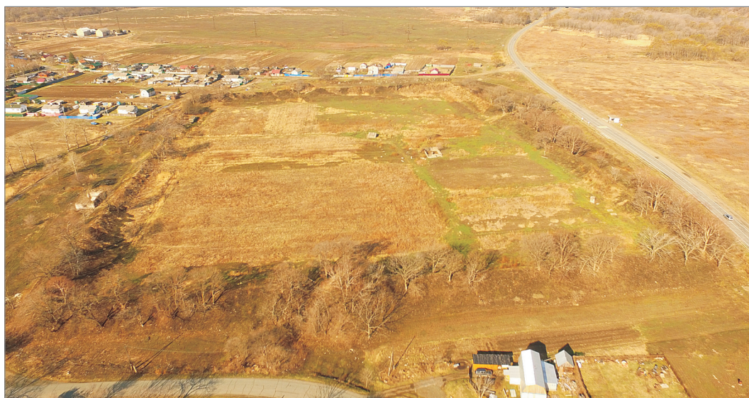
Рис. 2. Вид на Стеклянухинское I городище с северо-востока.