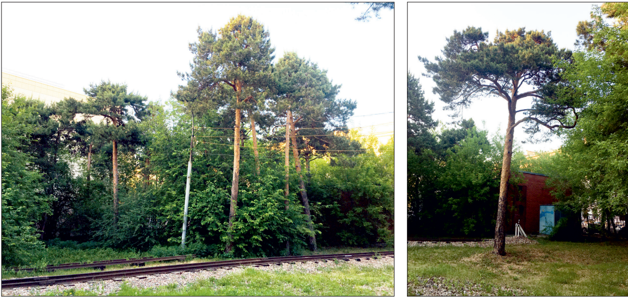
Рис. 4. Реликтовые экземпляры сосны обыкновенной, произрастающей на территории Центрального парка Красноярска.

Также на территории парка сохранилось несколько экземпляров реликтовых деревьев лиственницы сибирской в удовлетворительном состоянии, что свидетельствует об устойчивости данного вида в экологически сложных условиях города Красноярска. Под устойчивостью понимается способность растений противостоять воздействию экстремальных факторов среды (почвенная и воздушная засуха, засоление почв, низкие температуры, воздействие загрязняющих веществ, энтомовредители и фитопатогены) (Биологический энциклопедический словарь, 1986). Доля лиственницы сибирской в структуре насаждений парка составляет лишь 1.8 % (103 шт.), в том числе молодые посадки.