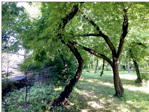
Рис. 5. Следствие межвидовой конкуренции клена ясенелистного и ели сибирской, произрастающей в живой изгороди.

часть (96 %) деревьев ели колючей ф. голубая имеют I и II категории жизненного состояния (см. таблицу). Следует отметить, что негативным фактором, оказывающим влияние на состояние елей, является деятельность заведений общепита, расположенных в непосредственной близости от произрастающих на территории парка деревьев.