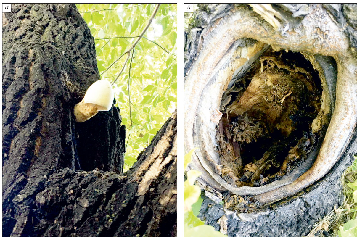
Рис. 3. Структурные изъяны стволов деревьев клена ясенелистного, произрастающего на территории Центрального парка Красноярск.

а – плодовые тела дереворазрушающих грибов; б – дупло.