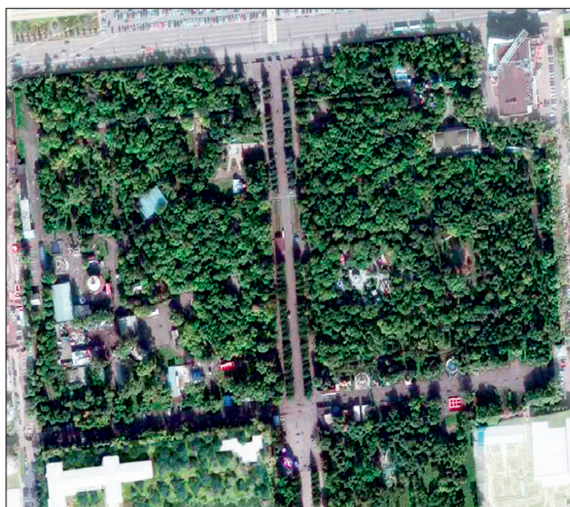
Рис. 1. Центральный парк Красноярск на спутниковом снимке (Google Earth, 2022).

Проведен сплошной пересчет древесной и кустарниковой флоры парка с установлением видового названия, жизненной формы растений, категории жизненного состояния, поражения фитопатогенными заболеваниями и повреждения энтомофагами. Жизненное состояние оценивалось по 7-балльной оценочной шкале (Постановление..., 2021). Инфекционные болезни диагностировали по комплексу макропризнаков: специфические анатомо-морфологические нарушения у деревьев, репродуктивные образования возбудителей с использованием справочной литературы и определителей (Черемисинов и др., 1970; Кузьмичев и др., 2004).