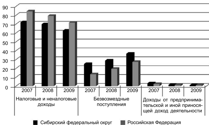
Рис. 1. Укрупненная структура доходов консолидированных региональных бюджетов, %

димность пересмотра понятия собственных доходов в законодательстве указывают и специалисты Счетной палаты [7]. При оценке собственных доходов здесь и далее объемы безвозмездных поступлений мы не учитываем.