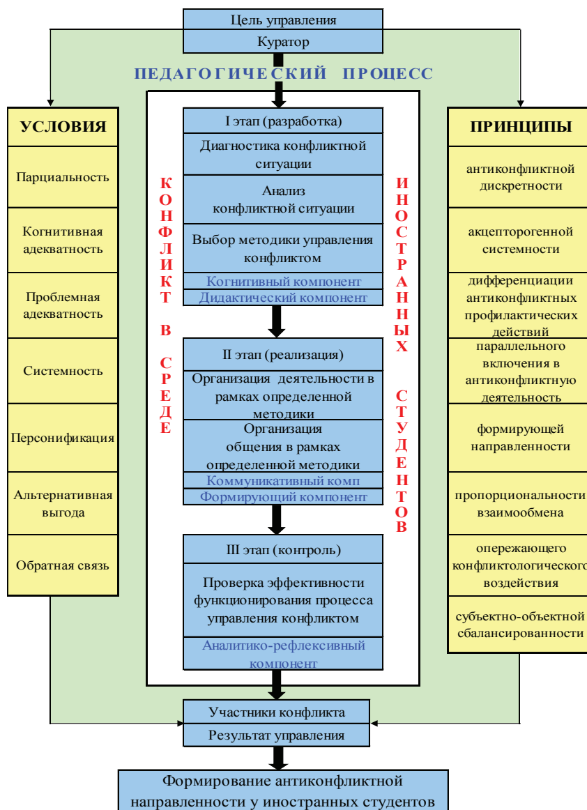
Рис. 3. Технология педагогического управления конфликтами в среде иностранных студентов (модель).

В своей исполнительской части педагогическое управление конфликтом предполагает приведение в действие движущих сил развития личности. Одновременно оно включает в себя и корректировку поведения участников конфликта, что обеспечивает единство объективного и субъективного в педагогическом процессе.