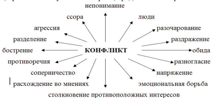
Рис. 1. Собираемая картина ассоциаций иностранных студентов, связанных со словом «конфликт»

В течение 2012 года, используя методы анкетирования, тестирования, интервьюирования, неформальных бесед и наблюдения, мы провели исследование состояния конфликтов в среде иностранных студентов БелГСХА им. В. Я Горина. Мы изучили отношение иностранных студентов к конфликтам, выявили их мнение относительно причин возникновения конфликтов, а также определили типичные формы их поведения в конфликтных ситуациях. Для того чтобы выяснить, что же такое конфликт в понимании иностранных студентов, мы использовали метод ассоциаций: студентам было предложено написать в центре альбомного листа слово «конфликт/conflict», затем на этом же листе было предложено записать вокруг слова «конфликт/conflict» все ассоциации, которые возникают у них, когда они слышат о конфликте. Собираемая картина ассоциаций иностранных студентов, принимавших участие в опросе, представлена на рис. 1.