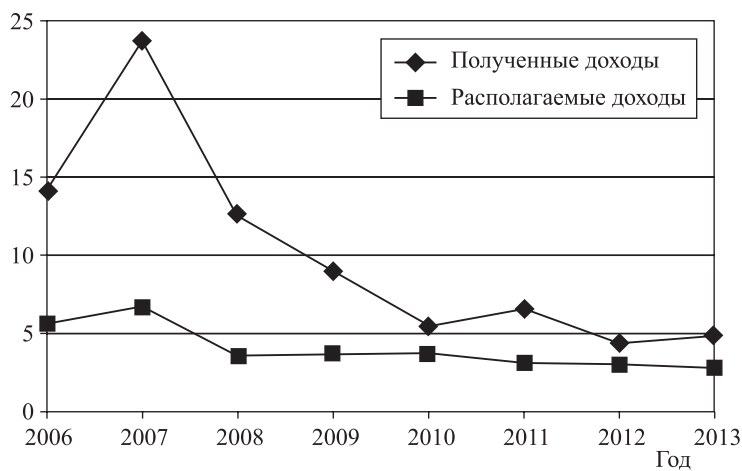
Рис. 2. Графическая интерпретация динамики коэффициента фондов