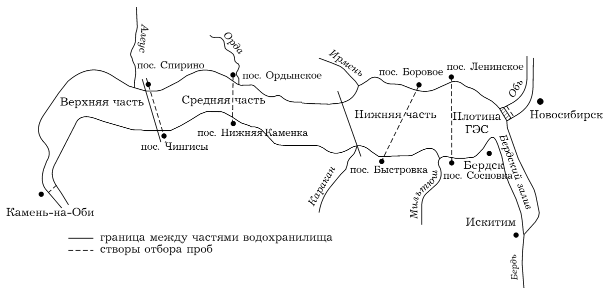
Рис. 1. Схема Новосибирского водохранилища

отмечены на рис. 1 (крупными точками). Отбор проб воды проводили с борта теплохода, а в зимнее время – со льда. Химико-аналитические работы выполнены в аттестованной лаборатории контроля качества природных и сточных вод ФГУ «ВерхнеОбьрегионводхоз» Минприроды РФ по стандартным методикам [4, 5]. Выполнена статистическая обработка химико-аналитических данных, в частности дисперсионный анализ результатов определения концентраций химических ингредиентов в пробах воды, характеризующих гидрохимический режим водохранилища в разные по водности годы и сезоны. При проведении статистического анализа [6, 7] рассмотрены первичные данные, т. е. значения концентраций химических ингредиентов (кислород, величины БПК и рН, главные ионы, биогенные элементы, фенолы, нефтепродукты) в течение года и сезона для всех обсуждаемых створов, т. е. именно из этих данных формировалось многомерное пространство признаков.