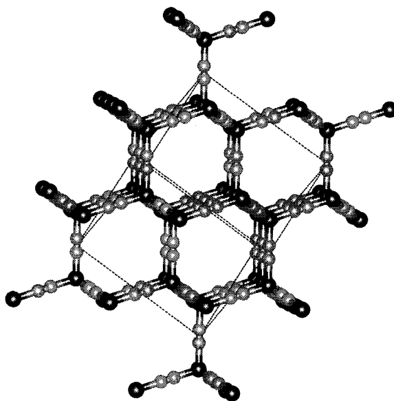
Рис. 2. Структура хозяина \text{Cd}(\text{CN})_2 типа Fd\bar{3}m (проекция на [110] ). Все гексагональные кольца, построенные из шести тетраэдрических атомов Cd, находятся в конформации кресла. Решетка хозяина топологически подобна H-кristобалиту