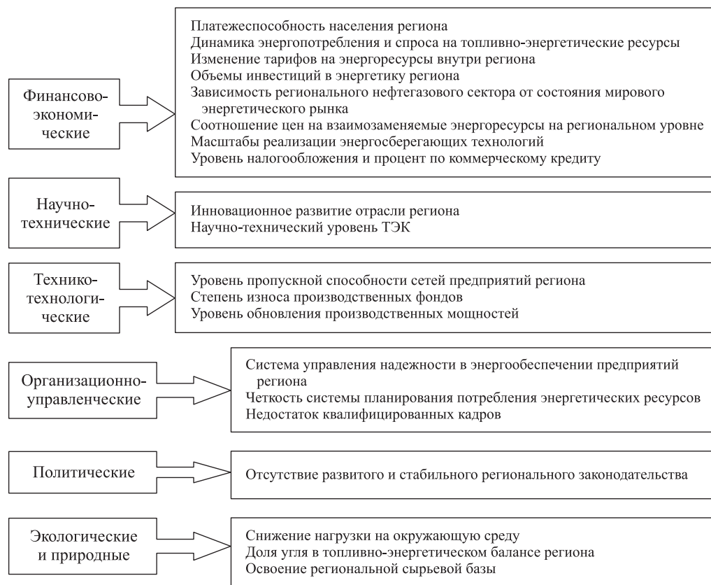
Рис. 3. Основные факторы, оказывающие ключевое влияние на устойчивое развитие

Изменение тарифов на энергоресурсы является одним из важнейших факторов устойчивого развития энергетического комплекса [2]. Уровень