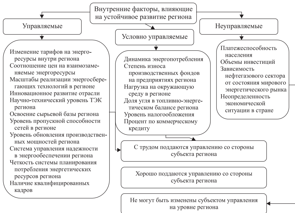
Рис. 2. Классификация факторов, оказывающих влияние на энергетический комплекс региона по степени воздействия на них

Вопрос управляемости факторов имеет первостепенное значение для оценки внутренних резервов отрасли региона. На рис. 2 представлена классификация внутренних факторов, оказывающих влияние на энергетический комплекс региона, на управляемые, трудноуправляемые и неуправляемые.