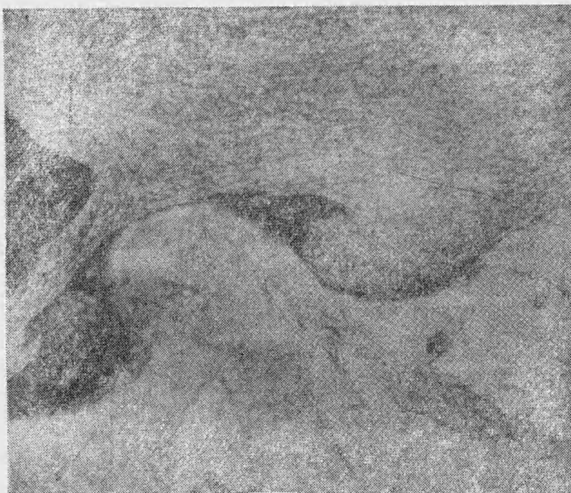
Рис. 1. Микрошлиф сварного шва молибден — медь

Для определения состава на рентгеновском микроанализаторе исследовались 10 участков зоны. Из них два участка, в которых наблюдалась четкая граница раздела, имели бездиффузионный переход, три участка с повышенной травимостью имели ширину зоны перемешивания 8, 10, 14 мк и относительно постоянный состав по сече-