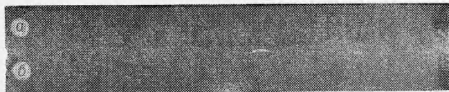
Рис. 3. Рентгенограммы.

плотно спрессованный молибден, нижняя — крупнозернистую медь, а центральная часть (~40 мм) — зону перемешивания молибдена и меди. Рентгенографически зафиксировано в центральной части смещение линий Мо в сторону больших углов по сравнению с линиями исходного материала. Как видно из рис. 3, положение линий меди после обжата не изменилось. Наблюдаемое смещение линий Мо свидетельствует об уменьшении параметра решетки, что связано, очевидно, с образованием твердого раствора Си — Мо (раствор замещения).