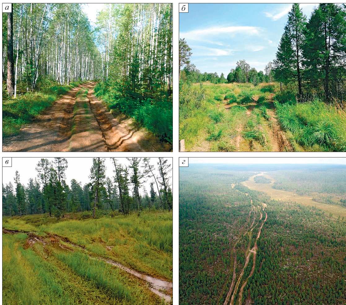
Рис. 4. Нарушения ландшафта, выявленные при исследовании участка автодороги от дер. Вершина Ханды до лесовозной дороги.

a — придорожный вторичный лес; б — наиболее нарушенный участок дороги до дер. Вершина Ханда; в , г — многодорожье, заболоченность (таяние мерзлоты).