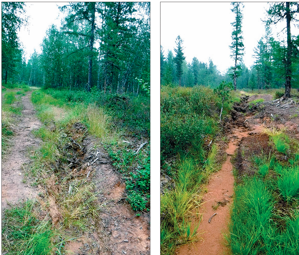
Рис. 5. Овраги (эрозионные рытвины) в районе исследования.