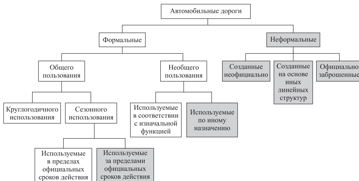
Рис. 1. Классификация формальных и неформальных автодорог по формам и режимам пользования.

Серым цветом показаны неформальные дороги и дороги с неформальным режимом использования.