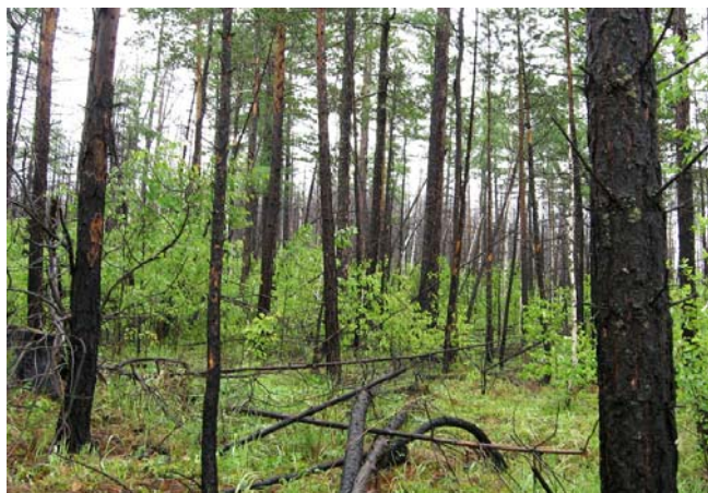
Рис. 1. Сосняк, пройденный пожаром пять лет назад (пожар высокой интенсивности 2003 г., Голоустненское лесничество).

Первая серия пробных площадей (ПП 1–3) заложена в Юго-Западном Прибайкалье на восточном макросклоне Приморского хребта в насаждениях Голоустненского лесничества Иркутской области (табл. 1).