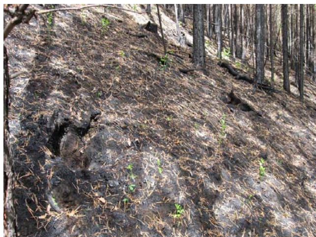
Рис. 2. Свежее пожарище в сосняке (пожар высокой интенсивности 2007 г., Кикинское лесничество).

При закладке ПП и их лесоводственно-геоботанической характеристике руководствовались методическими указаниями из книги