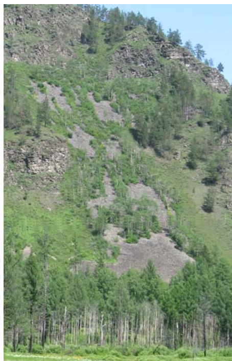
Рис. 3. Образование каменных россыпей после низового пожара (пожар 1989 г., Голоуственское лесничество).

Нарушение пожаром защитного растительного слоя на крутых склонах (25–30° и более) часто приводит к полному сносу мелкозема, в результате чего на поверхности местами обнажены плиты и крупные обломки горных пород. На крутых склонах мелкозем сохраняется лишь фрагментарно, в основном в западинах и на склонах крутизной менее 10°, а также под кронами отдельных сосен, обладающих мощной поверхностной корневой системой. Аккумуляцией мелкозема служат также приствольные зоны, расположенные по склону выше стволов деревьев и имеющие протяженность 1–2 м. Здесь же наблюдается и формирование органогенного пирогенного горизонта, причем более половины его запасов сосредоточено именно на этой площади. Однако очень часто в условиях горного рельефа на крутых скло-