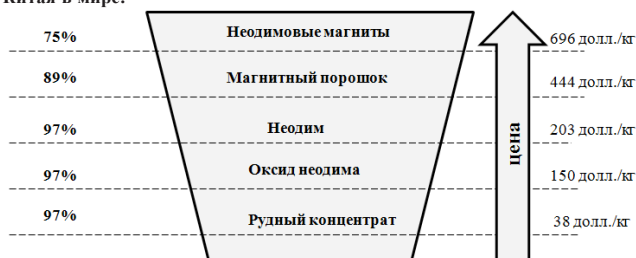
Рис. 1. Создание добавленной стоимости при производстве неодимовых магнитов – место Китая