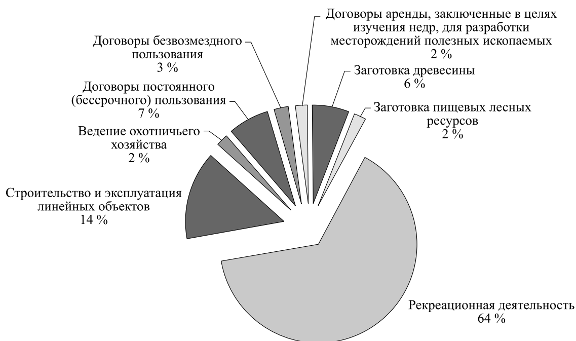
Рис. 2. Структура арендаторов лесного фонда в ЦЭЗ БПТ (Республика Бурятия) по видам использования.

Фактические объемы заготовки древесины в 2015 г. в границах районов Республики Бурятия, входящих в ЦЭЗ БПТ, составили 481,5 тыс. м 3 , или 15,5 % расчетной лесосеки. Доля объемов рубок ухода — 91,1 %. Основными лесопользователями в ЦЭЗ являются арендаторы участков земель лесного фонда, предназначенных для рекреационной, научно-образовательной, природоохранной (заповедники, заказники) деятельности, строительства и эксплуатации линейных объектов, заготовки древесины, пищевых лесных ресурсов, развития охотничьего хозяйства, а также для выполнения работ по геологическому изучению недр и разработке месторождений полезных ископаемых (рис. 2).