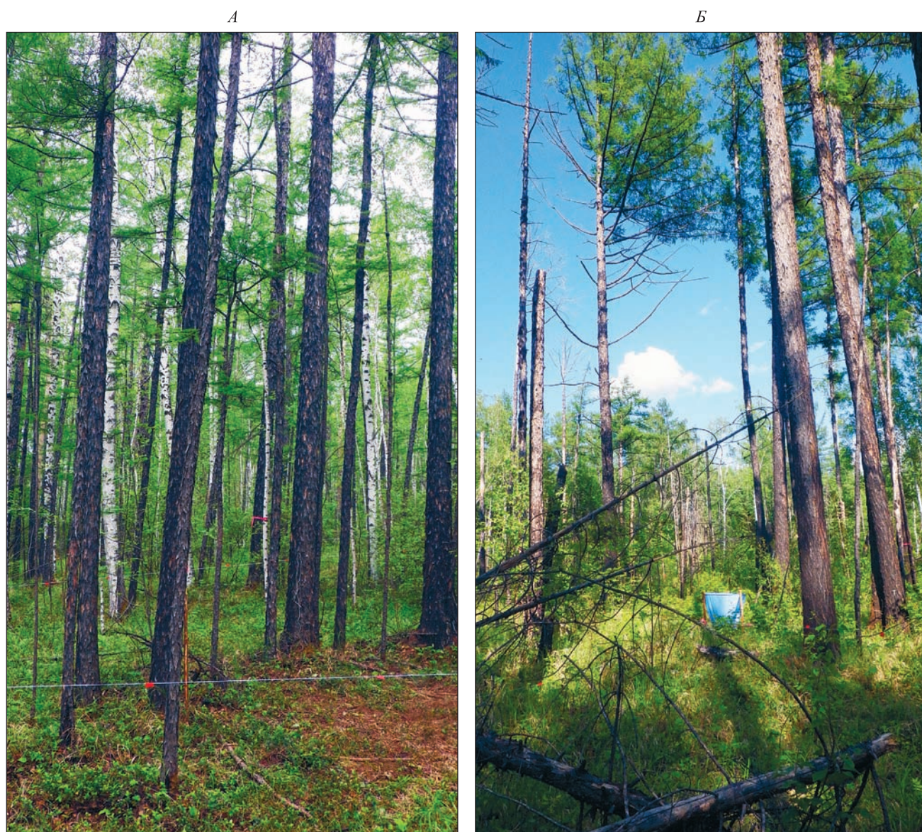
Рис. 1. Изучаемые древостои в фоновом (А) и постпирогенном (Б) насаждениях. Подробная характеристика природных условий и древостоев ПП приведена в предыдущей работе авторов (Брянин, Абрамова, 2017).

датчиков усредняли и сравнивали среднесуточную температуру почв. Лабораторные исследования выполнены в аналитическом центре минералого-геохимических исследований Института геологии и природопользования ДВО РАН. Проверку гипотез на статистическую достоверность различий и значимость рассчитанных статистик осуществляли при 5%-м уровне значимости. Для обработки результатов применяли методы многофакторного дисперсионного анализа ANOVA. Корреляционный анализ после нормализации данных проводили по методу Пирсона, а статистическую обработку данных – с помощью программ Microsoft Excel (2013) и R (R Development Core Team, 2014).