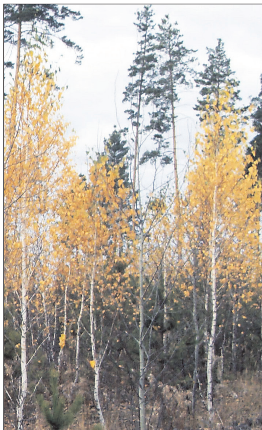
Рис. 3. Фрагмент 10-летнего опытного лиственного барьера, созданного посадкой дичков березы повислой Betula pendula по схеме размещения 1.0 × 3.0 м на гари 2004 г. в сосняке бруснично-мелкотравно-зеленомошном Старопросветского лесничества Курганской области.

устойчивых и эффективных для защиты от верховых пожаров культурных ЛБ, преимущественно с доминированием березы повислой (рис. 3), особенно на сухих песчаных почвах сосняков лишайниковых, где ее естественное возобновление отсутствует.