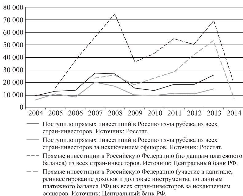
Рис. 1. Поступило ПИИ в Российскую Федерацию, млн долл. США.

В большинстве эмпирических исследований аналитическая работа ведется лишь с одним из двух параллельно существующих рядов данных, другой зачастую игнорируется. Однако в работах описательного характера могут использоваться данные из обоих источников, например, [6, 16, 20]. В большинстве работ (особенно с использованием эконометрики) предпо-