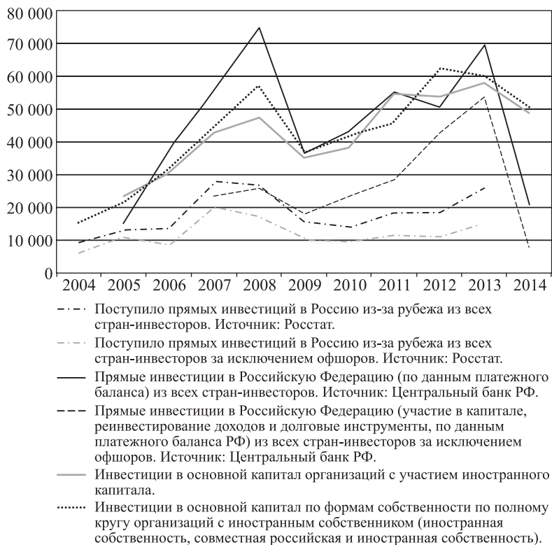
Рис. 3. Показатели инвестиций, млн долл. США