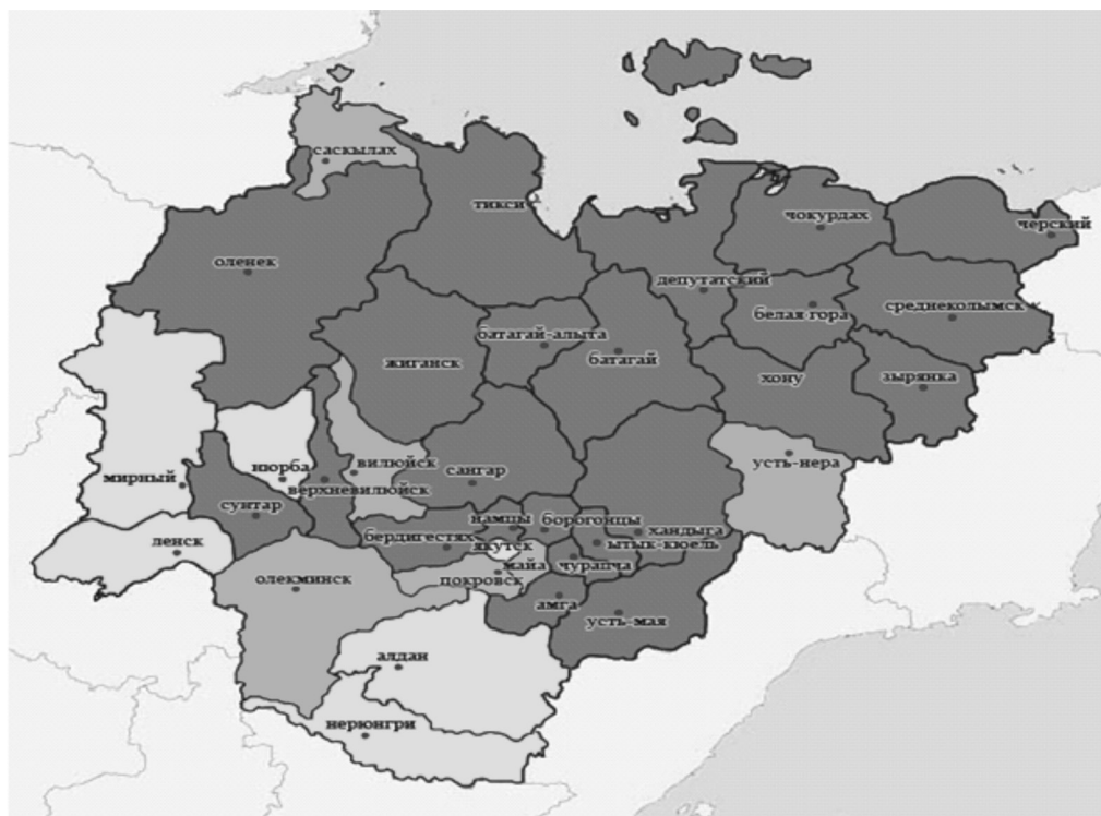
Рис. 1. Карта Республики Саха (Якутия)

2-я группа – муниципальные образования, занимающие долю в ВМП республики от 1 до 5 %;