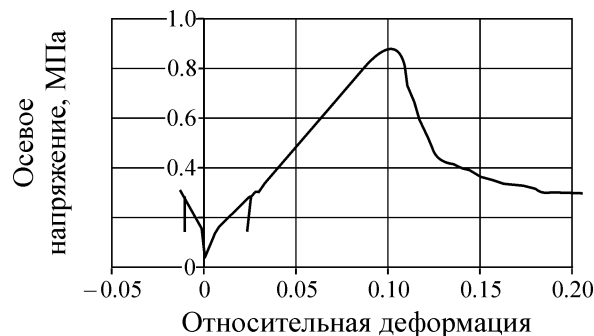
Рис. 1. Полная диаграмма деформирования глины аргиллитоподобной

Для записи в явном виде критерия (3) выполнена интерпретация полной диаграммы деформирования горных пород для исследуемого участка [3 – 5] (рис. 1).