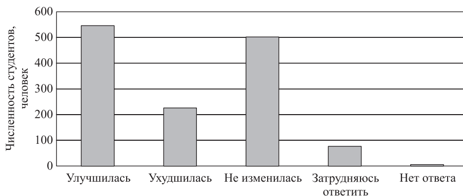
Рис. 2. Распределение ответов студентов НГУЭУ на вопрос 41 «Как изменилась Ваша успеваемость за период обучения?»

потенциал студента и его уровень достигнутых знаний (41 %), т.е. внутренние факторы. Наименьший удельный вес составляют такие факторы, как методы преподавания и профессионализм преподавателя, качество дополнительных услуг, работа деканатов и кафедр, т.е. внешние факторы – 2,9, 4,9 и 8,5 % соответственно.