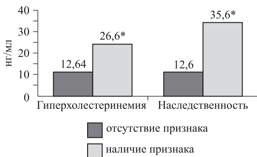
Рис. 1. Взаимосвязь уровня галектина-3 на 10–14-е сутки ИМ с анамнестическими данными. * – p < 0,05

Анализ показателей эхокардиографического исследования показал, что у пациентов с дилатацией левого желудочка (ЛЖ) и со сниженной фракцией выброса (ФВ) ЛЖ менее 40 % уровень галектина-3, оцененный на 10–14-е сутки, был значительно ( p = 0,02 ) выше, чем у пациентов с нормальными размерами ЛЖ и сохранной ФВ (рис. 3). Данные результаты подтвердились при проведении корреляционного анализа. Отмечена положительная корреляционная связь изучаемого биомаркера с конечно-диастолическим (КДР) и конечно-систолическим (КСР) размерами ЛЖ