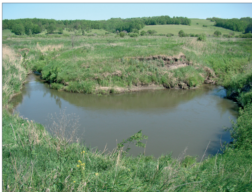
Рис. 2. Размываемый уступ выпуклого берега излучины р. Озёрки в расширении русла.

Примечание. Прочерк — наблюдения не проводились.