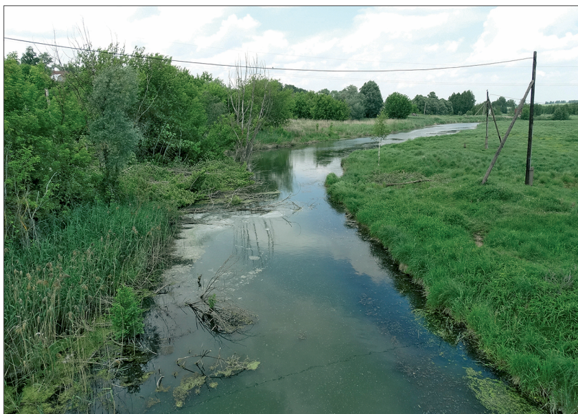
Рис. 3. Река Керметь (Шемлей) в пос. Дальнее Константиново в 1958 г. ( а ) и 2015 г. ( б ).