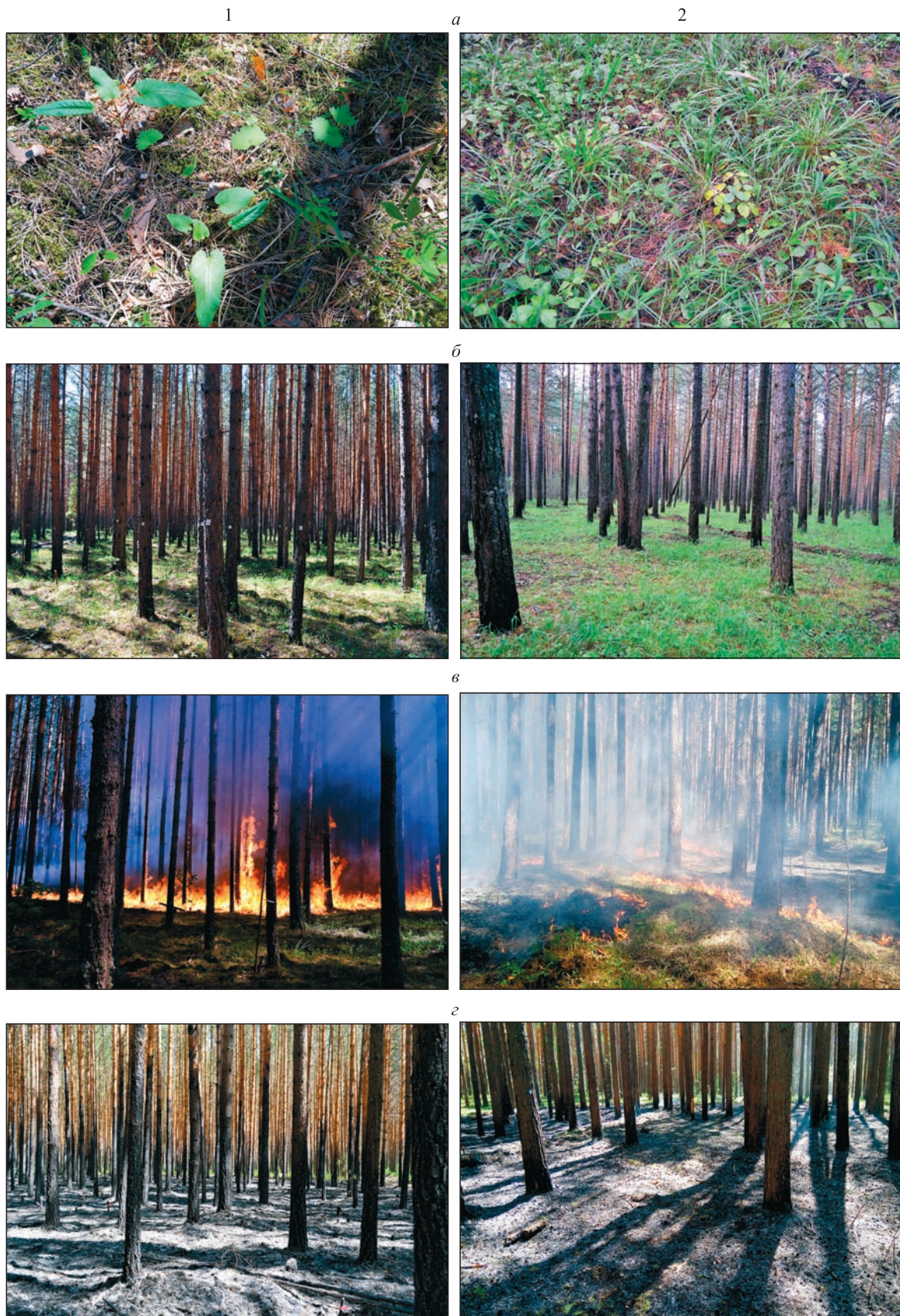
Рис. 1. Эксперименты по контролируемым выжиганиям на ПП. 1 – средневозрастной древостой; 2 – спелый древостой: а – живой напочвенный покров до пожара; б – древостои до пожара; в – экспериментальные выжигания; г – древостои и напочвенный покров после выжиганий.